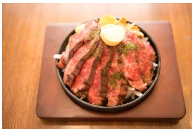
『オーガス プレミアムステーキ』

ストックヤードで長期穀物飼育されたハラミは柔らかく、脂肪とのバランスが絶妙です。