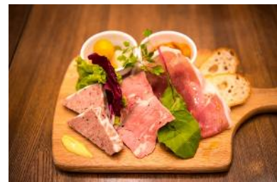
『前菜 5品盛り合わせ』