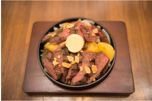
『オースト 天然カンガルーミート』

体脂肪燃焼効果と筋肉増強効果のある共役リノール酸をたっぷり含んださっぱりしてクセの無い赤身です。