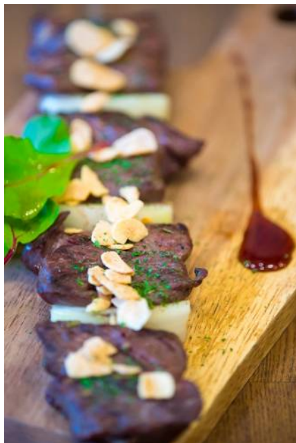
▲「オーガス名物！ビーフの串刺し」

また、ボリューム満点な肉の盛り合わせから、ハラミやサーロインなどの極旨ステーキ、肉メニュー以外にもチーズや生ハム、ガーリックオイル煮など、バルならではのお酒を楽しめるサイドメニューも充実しています。