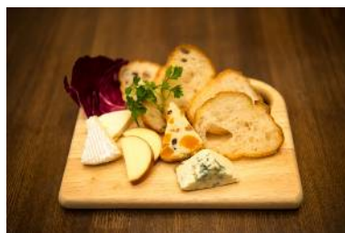
『特製チーズの盛り合わせ』

ストックヤードで長期穀物飼育されたハラミは柔らかく、脂肪とのバランスが絶妙です。