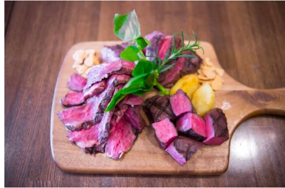
『肉のワンダーランド 5種盛り合わせ』

体脂肪燃焼効果と筋肉増強効果のある共役リノール酸をたっぷり含んださっぱりしてクセの無い赤身です。