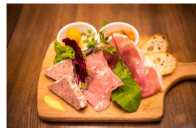
『前菜5品盛り合わせ』