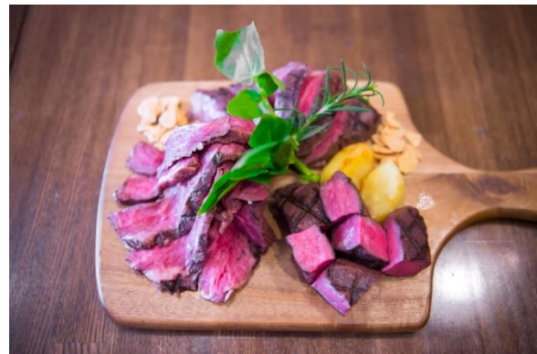
『肉のワンダーランド 5種盛り合わせ』

体脂肪燃焼効果と筋肉増強効果のある共役リノール酸をたっぷり含んださっぱりしてクセの無い赤身です。