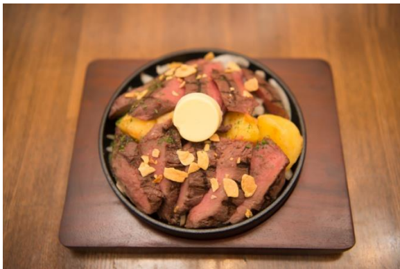
『オースト 天然カンガルーミート』