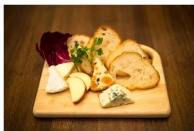
『特製チーズの盛り合わせ』

ストックヤードで長期穀物飼育されたハラミは柔らかく、脂肪とのバランスが絶妙です。